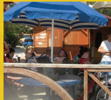
Uniamocionlus a Mondello 2009