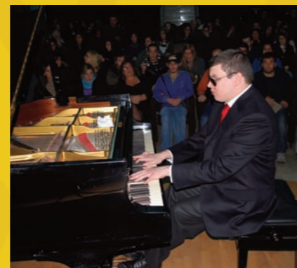
giornata Musica e disabilità 10-12-2009