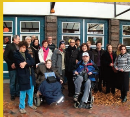
uniamocionlus a brema novembre 2009