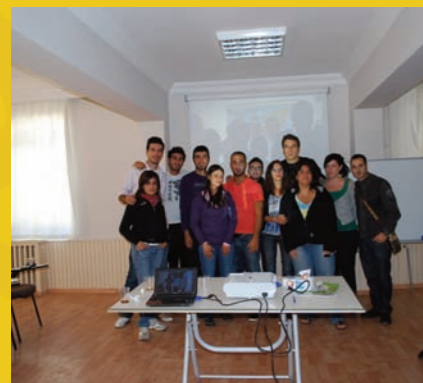
seminari in Turchia ott.2009