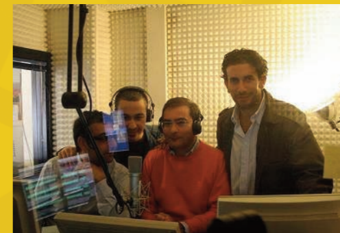
programma radiofonico “radio senza barriere”