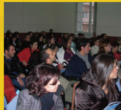
spettacolo comico teatrale 10 dicembre 2008