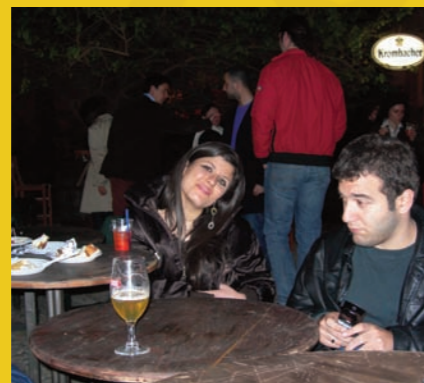
tesseramento malox 2009