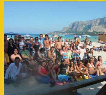
Uniamocionlus a Mondello 15 6 2009