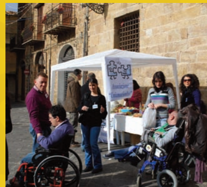
uniamocionlus a Castelbuono (sensibilizzazione sociale)13-12-09